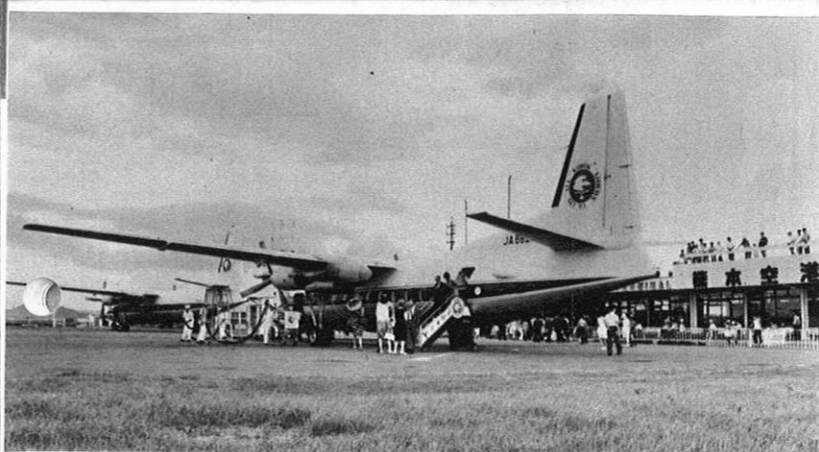
空の玄関口・熊本空港—7月から東京直行便も開通した。