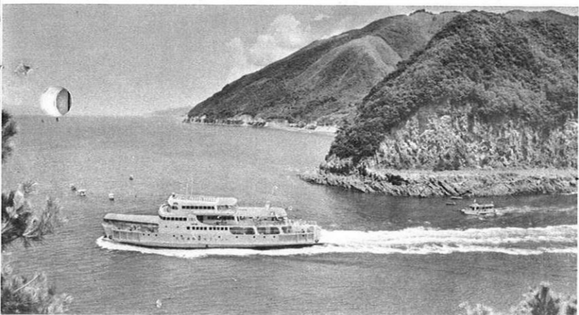
熊本と長崎を結ぶ“海を渡る国際観光ルート”九州横断フェリー