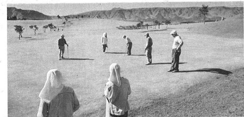
阿蘇山麓や黒石原の広々としたグリーンゴルフ場