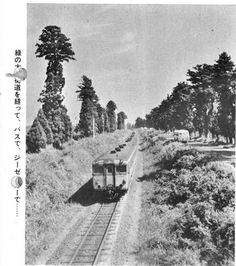
緑の十 街道を縫って、バスで、ジューゼーで……