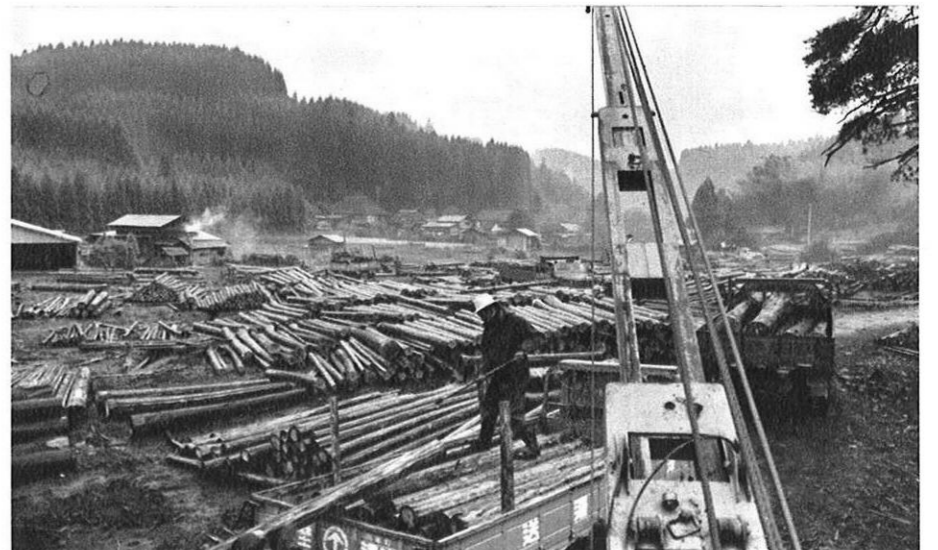
上・大規模な木材市場から、トラックで一斉に積出される