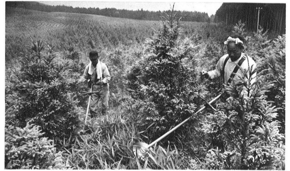
上・下刈機による作業は、従来のカマ刈に比べて3倍も違う