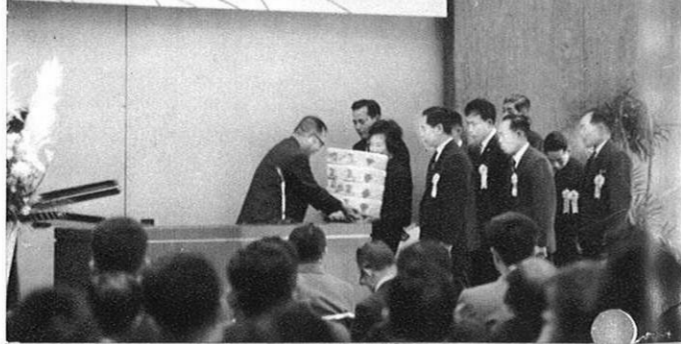
(2.25) 第四回県農業コンクールも活潑に行われた。