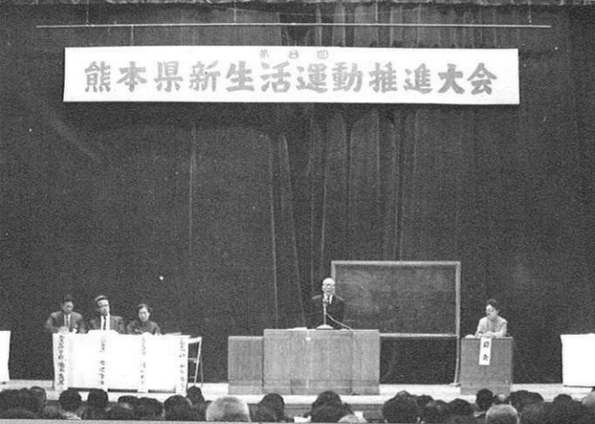
(2.26) 新生活運動推進大会 (県立図書館にて)