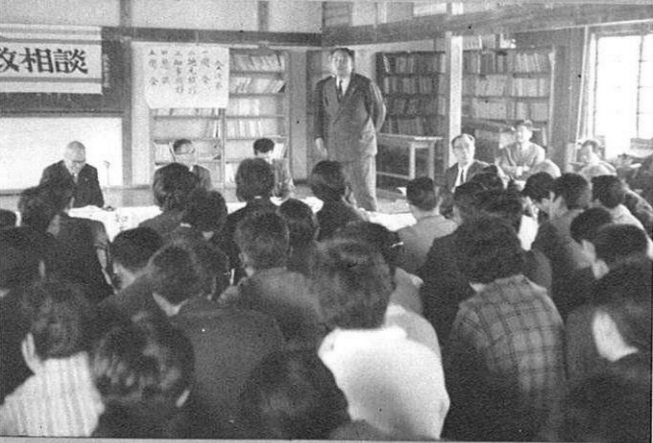
移動県政相談……熱心な質問が集中した。