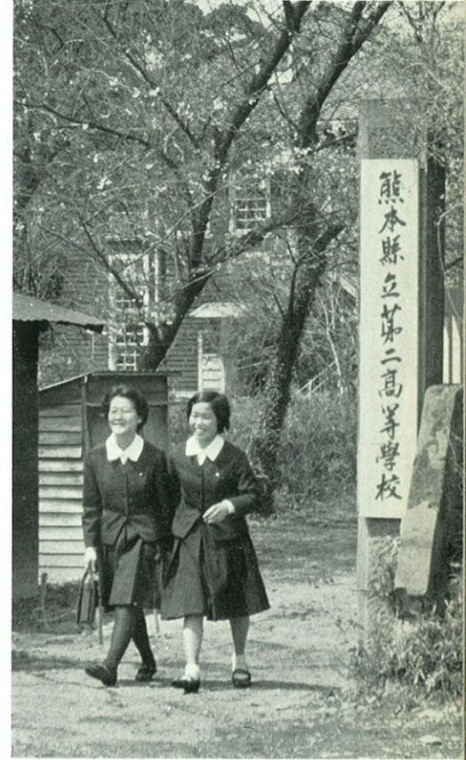
県立第二高校も熊本城内に新設された