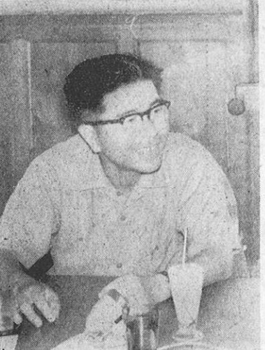
日本脳炎もビールスで…衛生部長

もつともつと増えていくと思われまうね。 —もうそんなに発生しているんですか。特に日本脳炎など恐ろしいですね。