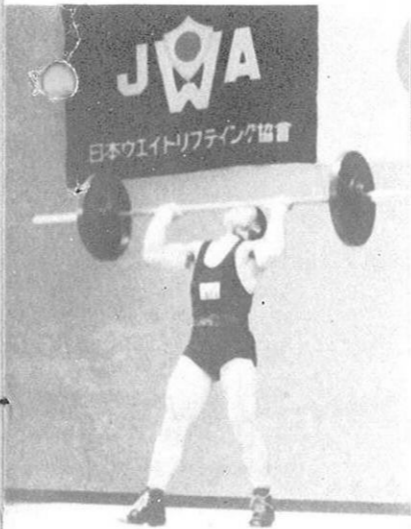
←ウエイトリフテング