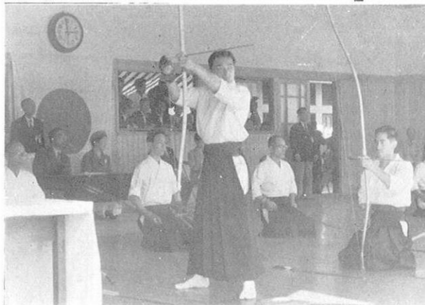
★ 両陛下のご臨席を仰いで弓道競技も活潑だった