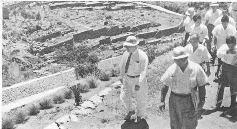
▲みかん畑開墾地をみる知事(河内芳野村にて)