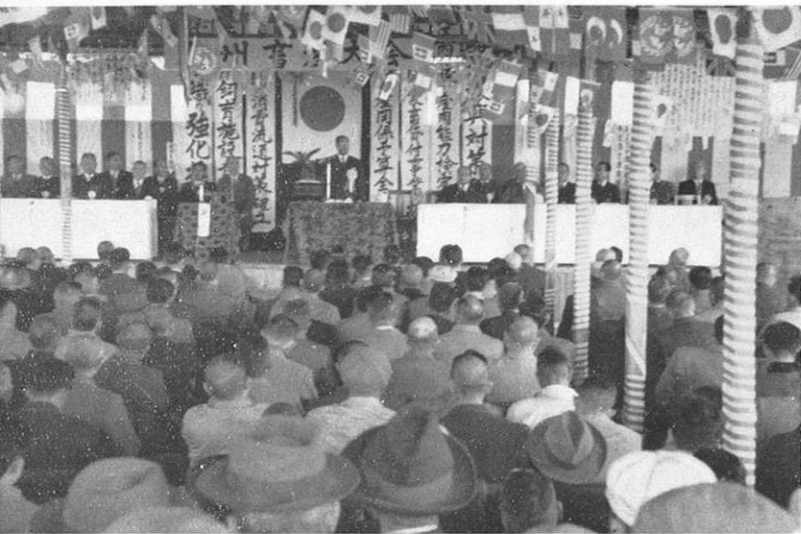
■ 畜産大会では功労者表彰や宣言などが行われた…… ☆