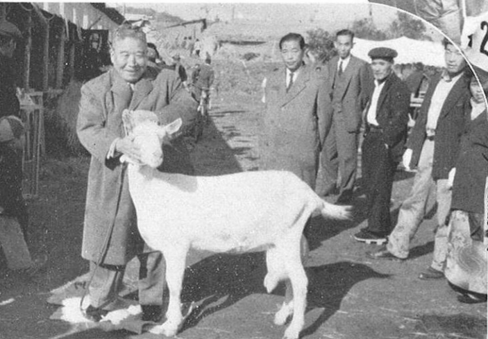
■ 「可愛いナ」と山羊を見る水上副知事…… ☆