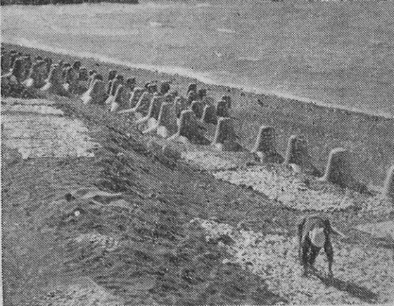
災害を防いだテトラポット…… 下田海岸には約500個のテトラポットが工事のために置いてあつた。これが激浪をくいとめて、民家の被害を防いだという。

まず民生関係のみならず、災害救助法による「応急仮設住宅」三十戸も十月一杯には全部完成。家を失つた人々は、さ、やかながらも屋根の下でこの冬をしのげるわけである。保護を要する家庭には「生活保護法」の手がさしのべられた。たち上るにも資金がない。こんな人々には「厚生資金」「世帯厚生資金」の道が開かれた。二つの貸出件数は合計八十三件、金額にして約三〇万円が人々の再起の支えとなつている。このほか医療費貸付、母子福祉資金、引