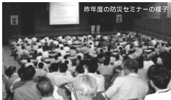
昨年度の防災セミナーの様子

8月30日(火)から防災週間が始まります。県民の皆さんに防災意識と知識を高めていただくため防災セミナーを開催します。入場は無料ですが、事前の申し込みが必要です。 日時 / 8月30日(火) 13:30~16:00 場所 / 県庁地下大会議室 テーマ / 今日から実践 身近な防災 講師 / 青野文江氏(財)市民防災研究所主任研究員)