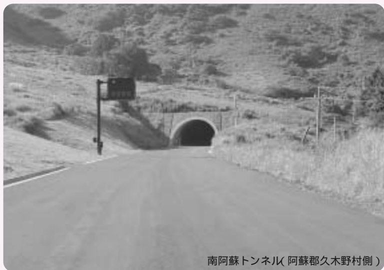
南阿蘇トンネル(阿蘇郡久木野村側)

お問い合わせ先 熊本県道路整備課 県道班 ☎096-383-1111(内線6114) FAX096-384-6121 電子メール douroseibi@pref.kumamoto.lg.jp