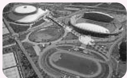
熊本県民総合運動公園

お問い合わせ先 熊本県土木技術管理室 技術管理班 ☎096-383-1111(内線6053) FAX096-381-0570 電子メール dogikanri@pref.kumamoto.lg.jp