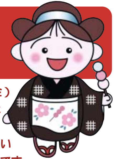
マスコット「おてもちゃん」