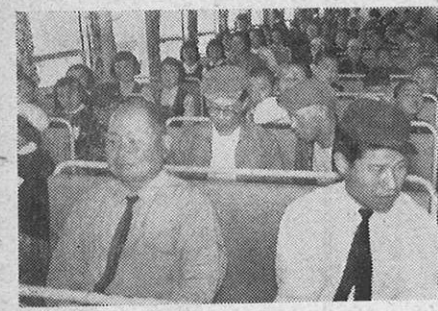
自動車利用者のための客室…★