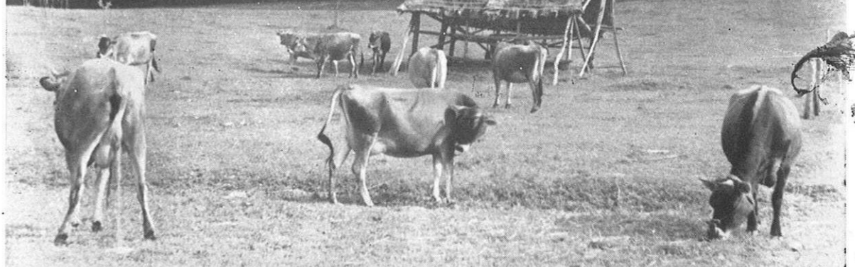
なごやかな牧場風景