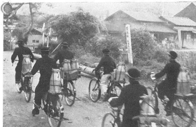
集乳はボクラの手で……

昭和三十一年一、南の大陸蒙州から、はるばる海をわたつて阿蘇の山おく小国郷に來た、九十八頭のジャージー牛はその後どうしているだろうか。 心ある人なら時々、思い出していただろう。その乳牛たちは、その後三十二年一回、三十三年二回と都合四回にわたつて輸入された友牛と合せて計五八八頭に達し、今ではすっかり日本の牛になつて酪農王国小国の建設にモウ進んでいる。 両小国(小国町、南小国村)の酪農家は約三五〇戸で乳牛は約八〇〇頭、つまり導入数