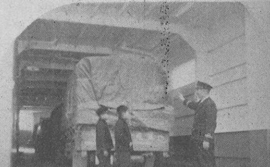
長崎のお客をたくさんおのせて