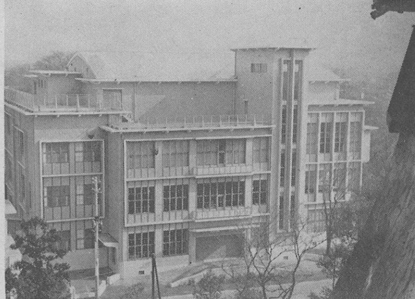
↑ 薄いピンク色に包まれたスマートな図書館の全景……遠くに阿蘇の銀嶺が見える日もある