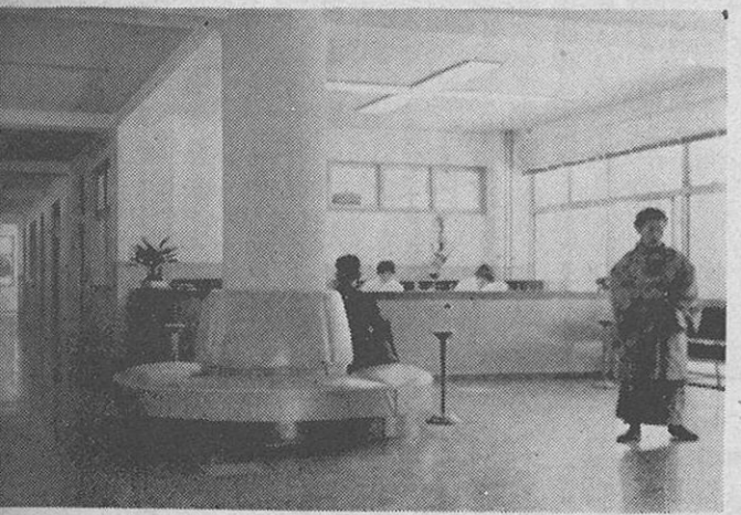
★ ★—————★ 病室の隅々まで、日光が入り、窓からの眺めも素晴らしい。 ↑ 真新しいベッドが整然と待機している。