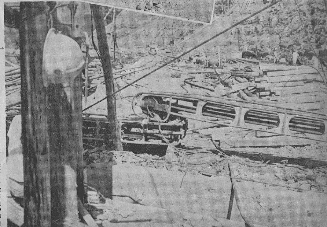
↑ ダム建設の基礎工事は、大規模な機械と、作業員の動員により、間断なく続けられてゆく。