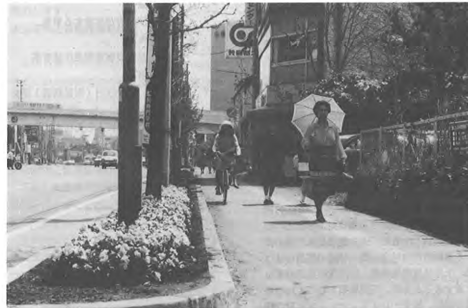
シンボル道路（熊本市九品寺附近）

★緑化推進指定道路、街路樹の整備管理…………… 4,436万円 熊本市内のシンボル道路の地方版ともいえるべき緑化推進指定道路（8路線10箇所）の維持管理を行って、地域の緑化を促進します。