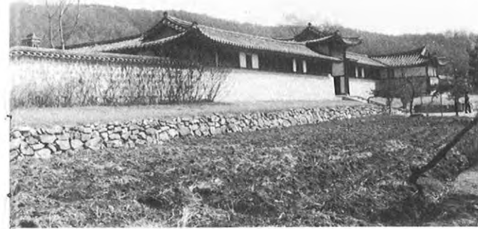
▲民俗村にはヤンパンの豪邸も立ち並ぶ