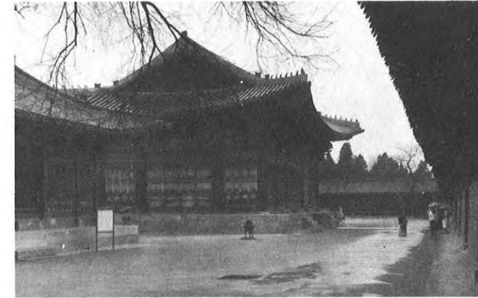
▲都心の中央庁裏にある景福宮