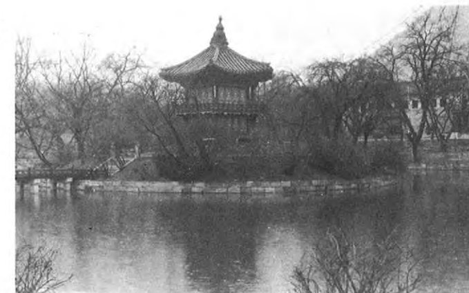
▲景福宮にある香遠亭