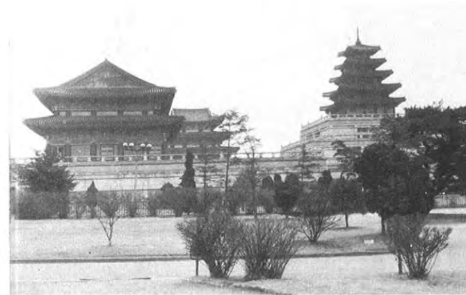
▲文化遺産 8万余点が陳列されている国立中央博物館