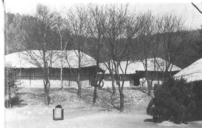
▲民俗村には200棟ほどの昔風の民家がある