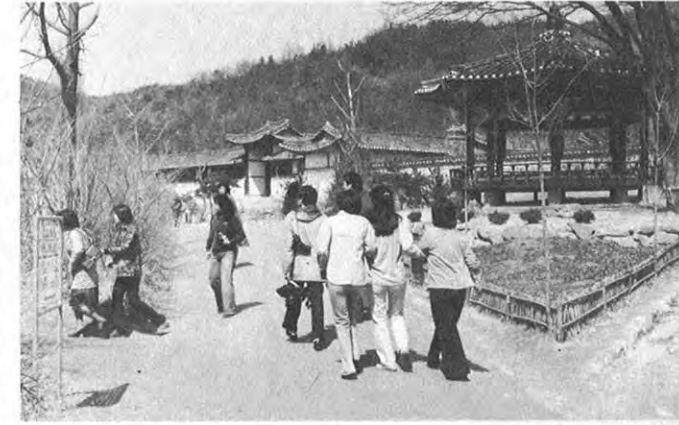
▲観光客で賑う民俗村