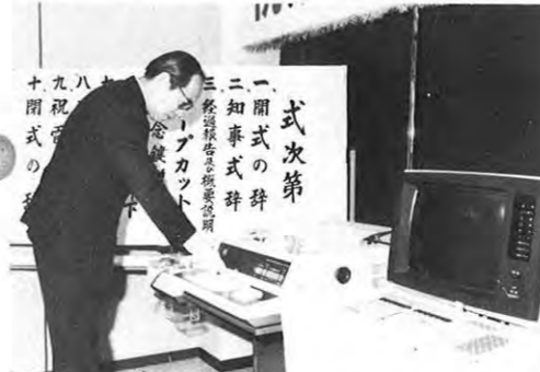
3.27一救急患者に対処する救急医療情報システムがスタートした。224カ所の医療機関から診療、手術の可否、空きベッド数などの情報が集められ、この端末装置が県内14カ所の消防本部に設置されている。