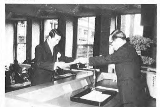
2.27一県農業コンクール大会の表彰式が県庁で行われた。式には農業関係者約300人が出席各部門の入賞者の栄誉をたたえた後、受賞者代表による経営発表等が行われた。