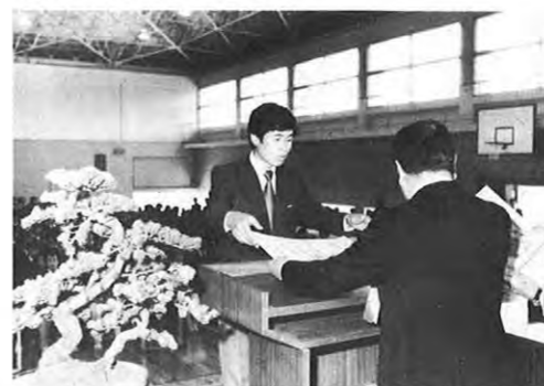
3.28一県立農業大学の第1回卒業式が同大学校体育館で行われた。第1期卒業生は女性10人を含む130人。ほとんどが農業後継者で、卒業後は自宅で農業者としての第1歩を踏み出した。