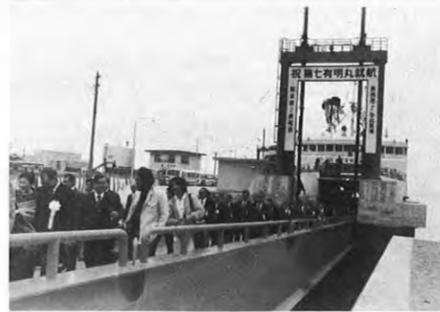
3.25一有明海に臨む玉名郡長洲港と長崎県多比良港間(14km)を結ぶ有明フェリーに新鋭フェリー「第七有明丸」が就航した。同船は旅客定員488人、自動車とう載は乗用車換算80台で、建造費は約6億円。