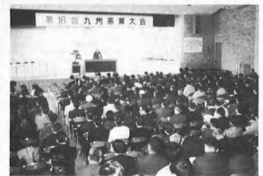
2.15一第16回九州茶業大会が県庁で開かれ、九州各県茶生産者、農協関係など約800人が参加、功労者表彰、意見発表の後、大会宣言と茶の品質向上、良質茶の生産等の決議を採択した。