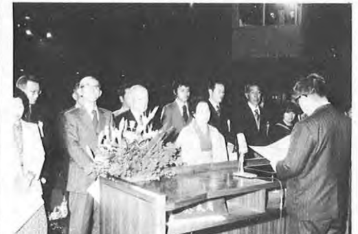
2.25一第6回美しい熊本づくり推進県民大会が熊本市で開かれた。関係者約300人が参加、美化運動の功労者表彰や実践活動の発表、記念講演などが行われた。