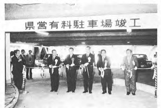
3.1一熊本市安政町に建設していた「県営有料駐車場」が完成した。同駐車場は6階7層の構造で、普通車333台を収容できる自走式。総工費6億6500万円。