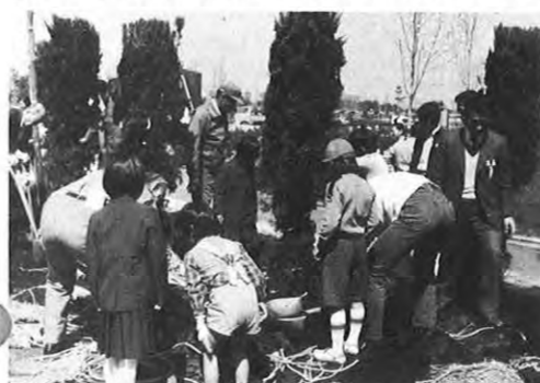
3.28一熊本市石原町の県民総合運動公園で県植樹祭が行われた。学校緑化やポスターコンクールの表彰式のあと、カイズカイブキ、ハクモクレンなど120本を植樹した。