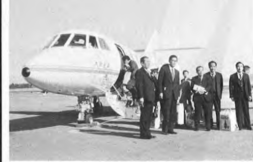
11.28 一国際空港化を進めている熊本空港に、初の外国機が着陸した。大韓航空の小型ジェット機で、同空港には、来年から日航がソウル-熊本間に定期的なチャーター便を飛ばす計画もある。