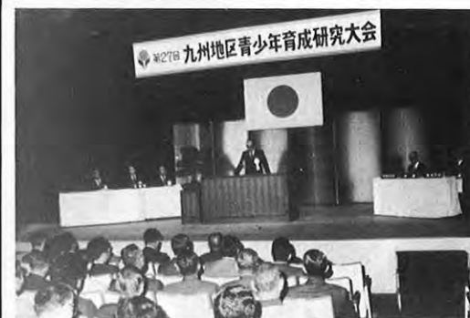
11.7—第27回九州地区青少年育成研究大会が熊本市で開かれた。大会には九州各地の関係者約700人が参加、衛藤藩吉東大教授の講演の後、全体会議を行い、「家庭教育充実強化」等の大会宣言を採択した。