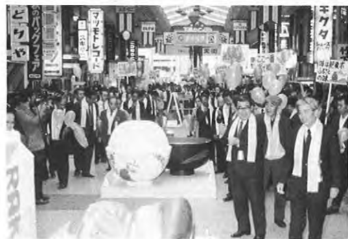
11.28 一米の消費拡大を目指す「熊本の米まつり」が熊本市の下通オーニング街で行われた。関係者約300人が参加し、藤本副知事が「米を見直そう」と挨拶した。