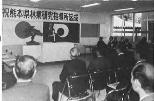
11.30 一県林業研究指導所の新築落成式が行われた。同所は建物の老朽化や敷地が狭いことなどにより熊本市の立田山中腹に移転新築したもので、地域林業振興の総合センターとなる。