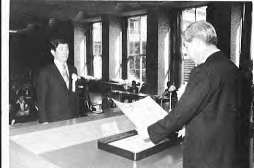
11.25 一昭和53年度納税功労者表彰式が県庁で行われた。式には関係者約90人が参加、藤本副知事がその功績をたたえ、労をねぎらった後、40の個人、法人及び団体に対し表彰状を贈った。