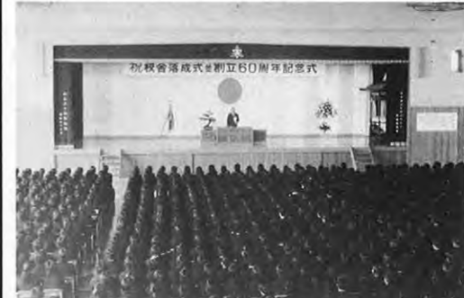
11.10—県立松橋高校の新校舎落成式が行われた。新校舎は総面積67,000㎡で旧敷地の2倍、また視聴覚教室など近代的な最新設備を備えている。同校では同日創立60周年記念式典も行われた。