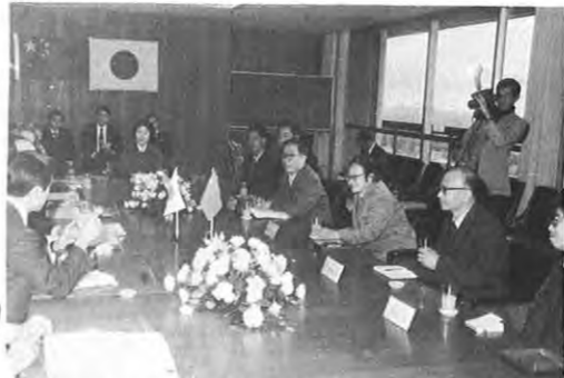
12.4 日本農業技術を視察している中国のソ業技術代表団の一行9人が沢田知事を訪問した。代表団は女性5人を含む農業施策、技術関係者で、最新のハウス農業技術を学ぶため本県を訪れたもの。