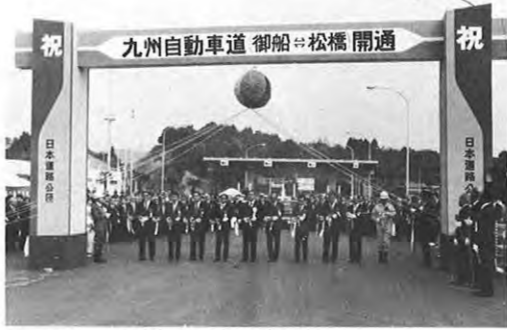
12.15 九州縦貫自動車道・御船-松橋間12kmの開通祝賀式が松橋インターで行われた。塚原古墳群保存のため当初予定より大幅遅れの開通となったが、この完成により福岡・若宮インターまで149.9kmが1時間半で結ばれる。