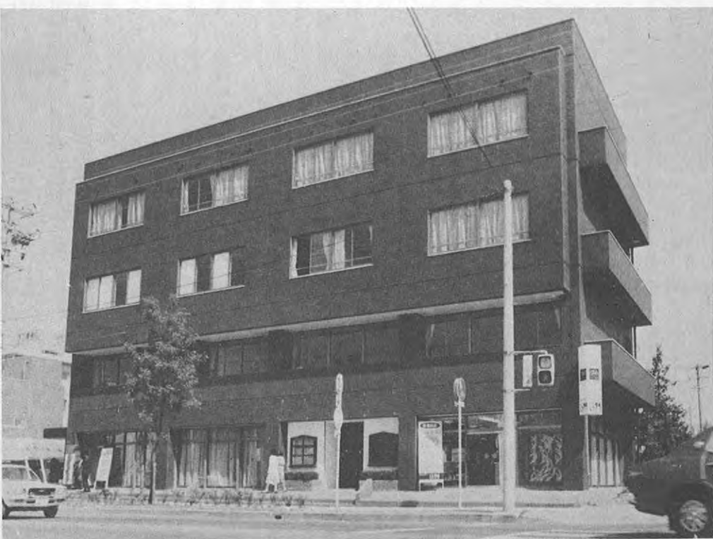
たときの婚礼に備え式場、披露宴場、美容室を設けています。 【所在地】 熊本市錦ヶ丘三四一三三(二八六二) 電話〇九六三一六七七〇八三

期限を一年以内として、一年ごとに、広告物の安全点検を行うこととして、破損したり、老朽したり、倒壊又は落下のおそれがあるもの、道路交通の安全を阻害するおそれのあるもの等は、掲出を禁止して、公衆への危害を防ぐこととしております。 一方指導面としては、許可申請書提出の際に、申請者に屋外広告物法及び県屋外広告物条例の主旨を説明し、又広告業者の講習会を年一回開いて必要な指導と助言を行って、違反広告物の掲示のないようにしています。 しかし、まだ、街には違反広告物が見受けられますので、県としては、次のとおり対策を講じております。 街の美観を損ったり、倒壊又は落下して、公衆への危害のおそれのあるもの、又は必要な管理を怠っている広告物については、必要な措置をとるよう措置命令をし、許可期限を越えているもの又は、許可条件に違反したとき、虚偽の申請その他不正の手段により許可を受けたときは、許可を取り消し、掲出することを禁止されているものについては、除却命令を出しています。又違反して掲出されているポスター、はり札及び立看板については、県が自ら除却を行うなどして、美観風致の維持及び公衆への危害の防止に努めているところであります。 なお、屋外広告物についての詳しいことや不明のことについては、県土木部計画課又は所轄の土木事務所にお問合せください。(計画課)