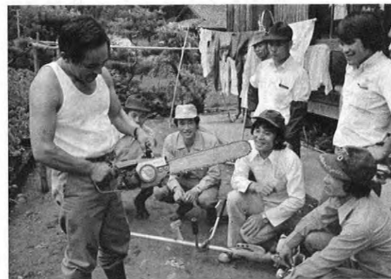
▲仕事の合い間をみては、機械の研究、手入れにも余念がありません。

▲林業経営には長時間を必要とします。それだけに木をいつくしみ、その成長を喜ぶといった、木との心の通い合いがなければこの仕事に打ち込むことはできません。(写真は立木の高さ・太さ・材積の測定)