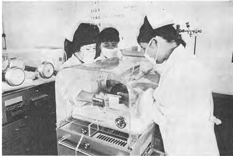
総合医療体制の確立を……