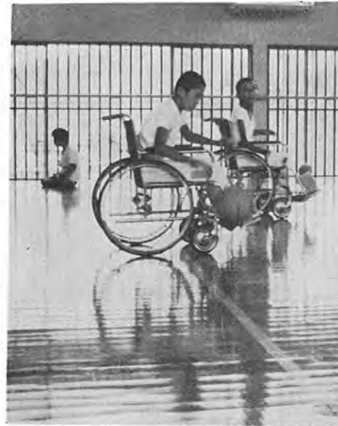
バスケットに興じる心身障害児（松橋療護園で）