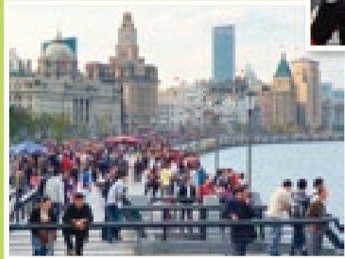
活気にあふれる中国経済の中心地