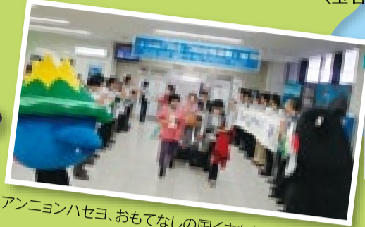
アンニョンハセヨ、おもてなしの国くまもとへ