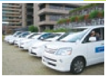
便利さが大人気のレンタカーツアー