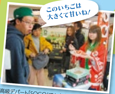
このいちごは大きくて甘い!