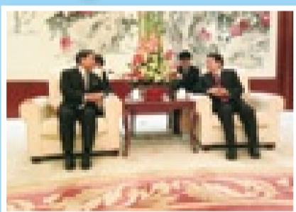
経済交流の推進について自治区のトップと対談