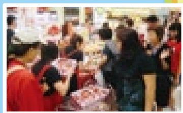
高級デパート「伊勢丹」でも熊本の農産物はひっぱりだこ

シンガポールから熊本に、修学旅行やレンタカーツアーに来る人が増えてるモン。そして、熊本の農産物はシンガポールでもっと売れてるよ。もっと熊本のPRに僕も頑張らなくちゃ。