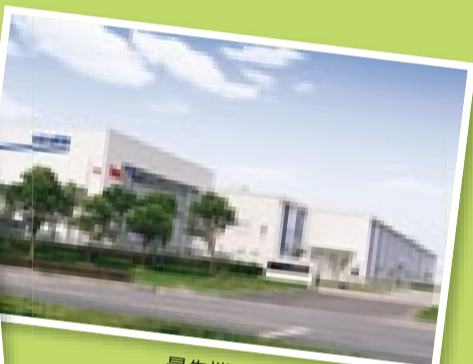
最先端の技術でグローバルに展開する平田機工グループ