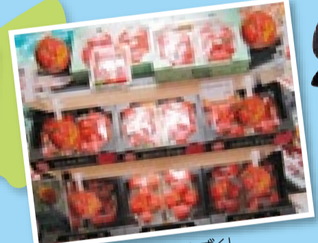
果物売り場の主役「ひのしずく」