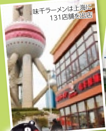
味千ラーメンは上海に131店舗を出店