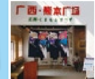
ホットな情報を発信 熊本のアンテナショップ 広西・くまもとプラザ