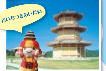
深い歴史がある鞠智城