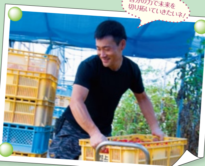
自分の力で未来を切り拓いていきたいネ!