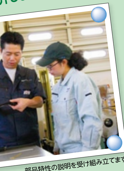
部品特性の説明を受け組み立てます

生徒さんにとっても、若いうちから現場を体験し将来を具体的に考えることができる良い機会。研修が終わる頃には現場のすごさや、やりがいを実感してくれているようです。仕事に対する心掛けも教えており、生徒さんたちが社会に出た時、当社で経験されたことや考えたことが少しでもプラスになればうれしいです。