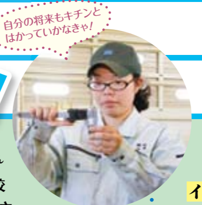
自分の将来もキチンと はかっていかなきゃ!