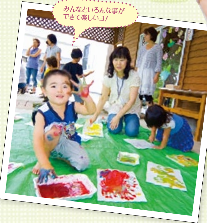
みんなといるん事ができて楽しいヨ!