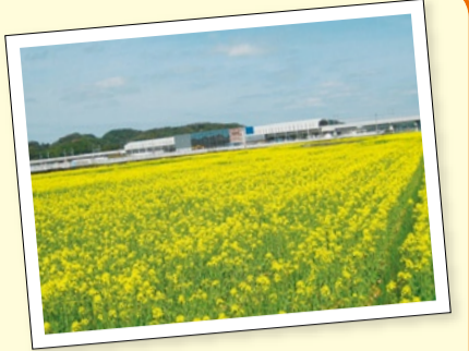
県では、新幹線の沿線に、菜の花やヒマワリなどを植えておもてなしをする「イエロープロジェクト」を今年度から始めます。

お問い合わせ先 玉名地域振興局総務振興課 ☎0968-74-2113 http://www.pref.kumamoto.jp/site/tamana-hp/