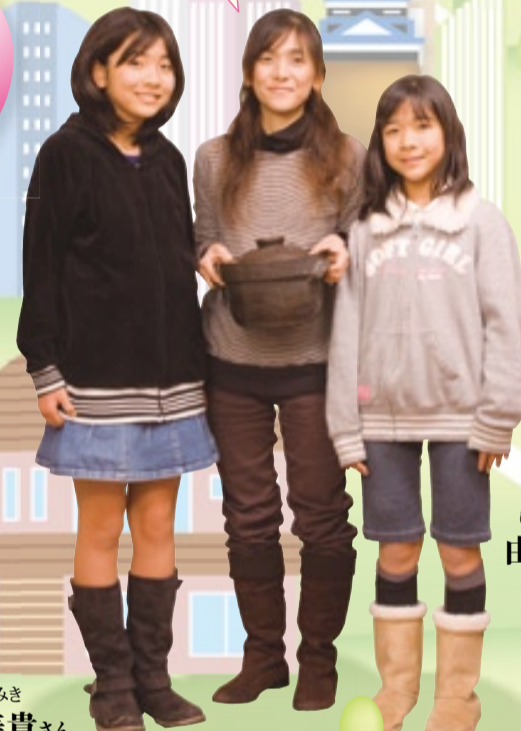
省エネを 楽しまなくちゃ!