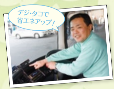
デジタルで 省エネアップ!

今後は情報を他社とも共有し、トラック業界全体での取り組みの推進につなげていきたいと考えています。