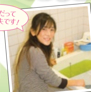
お風呂だって ひと工夫です!

平成17年に、くまもとエコファミリーに登録。お風呂の保温シート活用や、毎日の電力使用量やCO 2 排出量に分かる『省エネナビ』の利用により省エネ達成度を把握する活動で、平成20年度実践行動キャンペーン家庭部門最優秀賞を受賞しました。