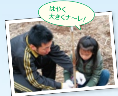
はやく大きくナレ!

熊本県中小企業家同友会(会員:中小企業経営者約700人)では、平成20年から阿蘇郡西原村で、5年間に5千本の植樹を目標とした広葉樹の森づくり活動を行っています。作業には、会員だけでなく、会員外のゲスト参加もできます。