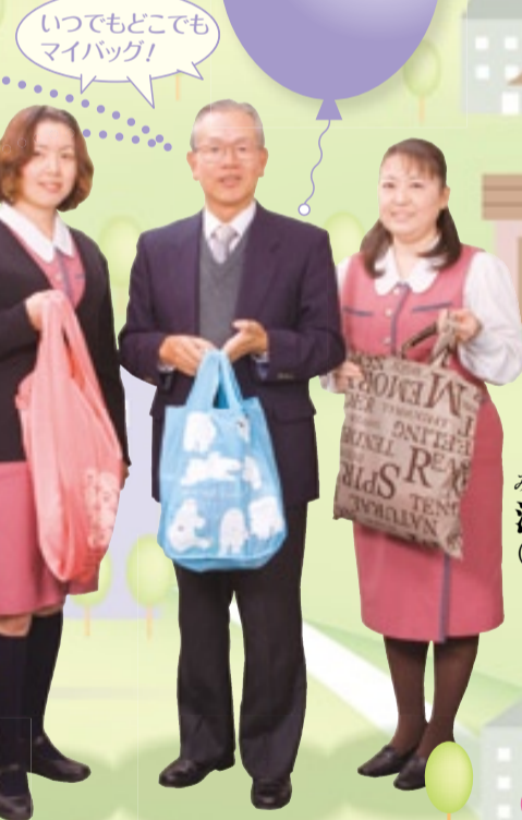
いつでもどこでも マイバッグ!