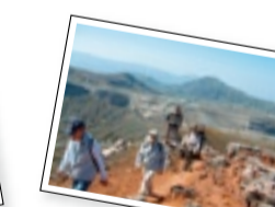
エコツーリズム 中央火口丘登山(阿蘇)