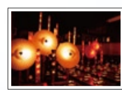
山鹿灯籠浪漫・百華百彩

各地域の催事や祭りなどを活用しながら、各地の特色を生かした事業を展開していきます。