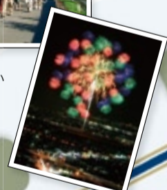
やつしろ全国花火競技大会