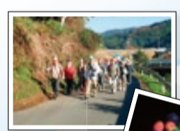
薩摩街道 歴史ふれあいウォーク (水俣・戸北)