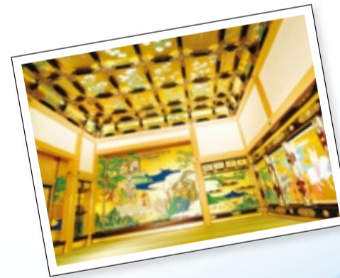
熊本城本丸御殿の昭君之間(しょうくんのま)