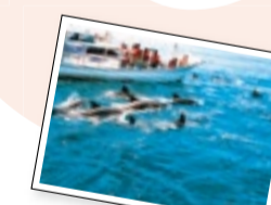
イルカウォッチング (天草市五和町)

熊本を訪れた人々が、バスや鉄道などで阿蘇や天草などへスムーズに移動できるような取り組みを進めています。また、熊本の各地域を訪れた方に楽しんでいただくため、地域の人々と農作業体験などで交流を深めたりする「くまもとツーリズム」を進めています。さらに、そこで生まれた大きな感動が、熊本への定住・移住につながることも期待しています。