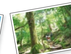
市房山トレッキングツアー (水上村)