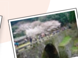
日向往還歴史ウォーク (上益城)