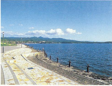
水俣湾親水護岸(水俣市)

七浦(田浦、湯浦などの七つの浦)と呼ばれた美しい海岸を持つ水俣・芦北地域。その美しい海を守り育てながら、それぞれ個性のある「浦」を二つの帯状につなぎ、海浜でのレクリエーションを中心とした健康・保養基地として振興を図っていくと、県総合計