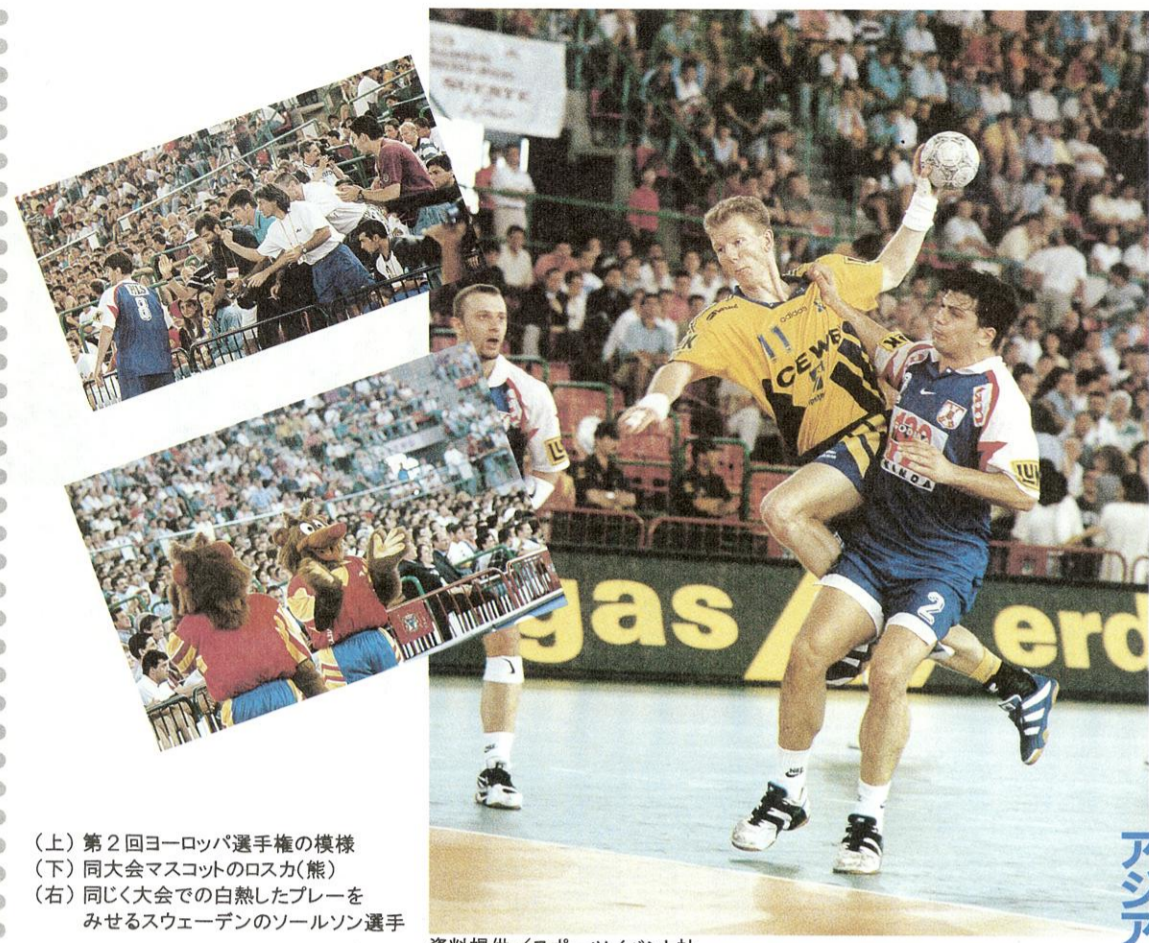
(上) 第2回ヨーロッパ選手権の模様 (下) 同大会マスコットのロスカ(熊) (右) 同じく大会での白熱したプレーをみせるスウェーデンのゾルソン選手

いよいよ、第十五回男子世界ハンドボール選手権大会の熊本開幕が、来年五月十七日に迫ってきました。これまでの開催地はすべてヨーロッパ圏です。初めてのヨーロッパ以外の開催地に、私たちの熊本が選ばれたことになりました。世界のスポーツファンが熊本に集まるビッグイベントだといえるでしょう。さて、ハンドボールの魅力は、格闘技ともいえる激しい攻防。その技とスピード感です。だからこそ、ヨーロッパでは人気スポーツとして多くの観客を集めているのです。世界の一流選手たちが繰り広げる、アメフトやラグビーと並ぶといわれるその激しいプレーを、早く生で観戦したいものです。世界の強豪二十四カ国が世界チャンピオンを目指しますが、日本チームもベスト8入りを目標に強化を図っているとのこと。日本チームの奮闘に期待しましょう。