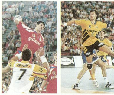
ロシアのパワーヒッター「王国」スウェーデンのサウスポストマンカーレン

この選手を見逃すな！ もちろん、ハンドボールにも超一流のテクニックを持ったトッププレイヤーがいる。ここでは世界大会でしか観れない、世界のトップ2人に注目だ。