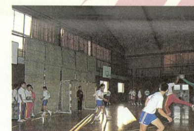
熊本市立商業高校ハンドボール部 オムロン女子チーム。数多くの栄冠を獲得したまさに日本トップのチーム。