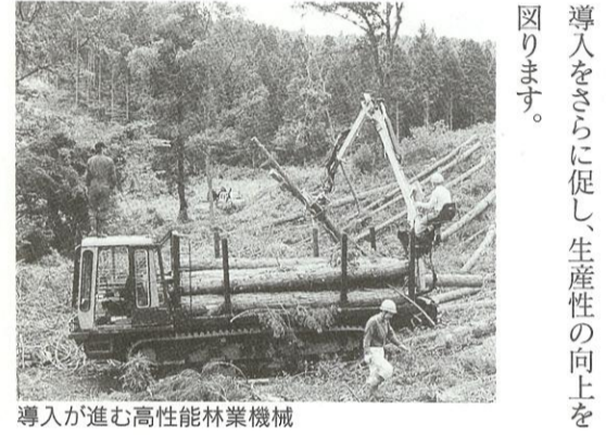
導入が進む高性能林業機械

こうしたニーズに応えるため、県内の森林を木材生産や環境保全、憩いの場などに区分し、それぞれの機能に合わせた整備を進めることを全市町村と協力して検討しています。