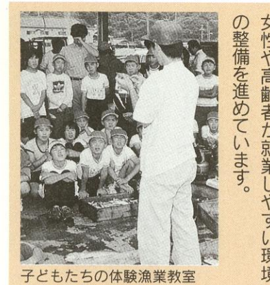
子どもたちの体験漁業教室

水産業 指導的立場に立つ「漁業士」を育成しています。また、青少年などを対象に体験漁業を行っているほか、女性や高齢者が就業しやすい環境の整備を進めています。