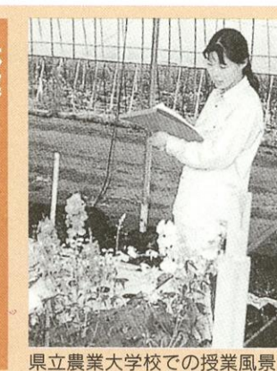
県立農業大学校での授業風景

熊本県の産業を元気にしていくのは、それぞれの産業にたずさわる一人ひとりで、これからの時代を担う人づくりについて紹介いたします。