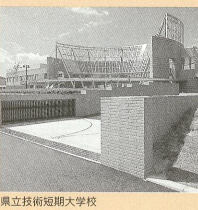
県立技術短期大学校

時代の変化に対応できる高度な技能を持った人材が必要とされていることから、昨年四月に、県立技術短期大学校を開校。