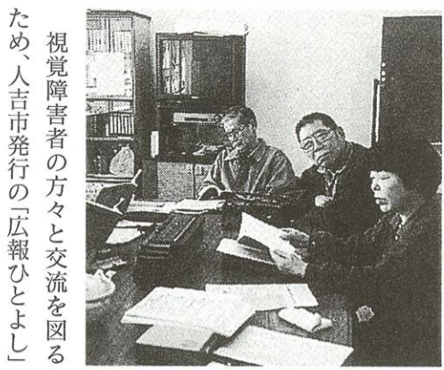
視覚障害者の方々と交流を図るため、人吉市発行の「広報ひとよし」