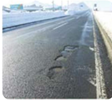
路面の穴ぼこ・ 段差