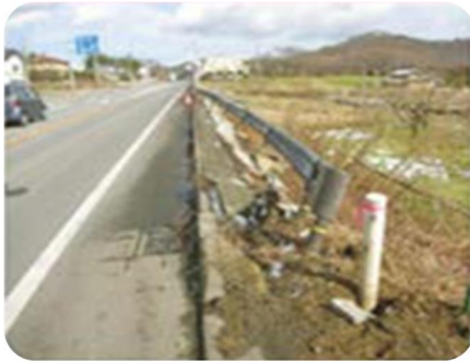
ガードレール・ 標識等の損傷