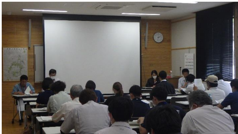
阿蘇家保会議室における会議の様子

特定家畜伝染病対策会議では、韓国の口蹄疫等特定家畜伝染病の発生状況や高病原性鳥インフルエンザ発生時の対応（市町村及び農業団体との連携等）並びに豚熱の予防的ワクチン接種に関する説明を行い、阿蘇地域における関係機関との連携及び防疫体制が確認されました。