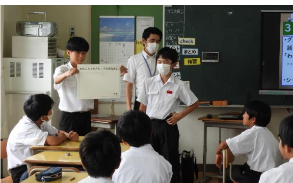
【グループ内の共通点を紹介】