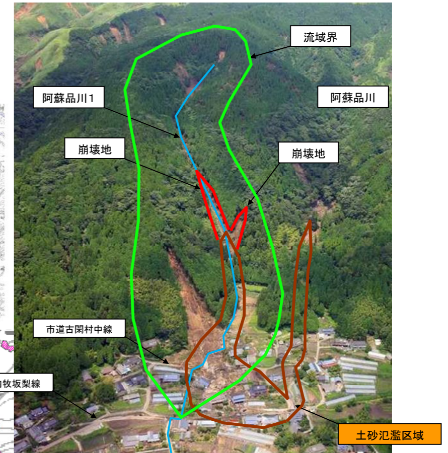
写真. 災害直後の状況