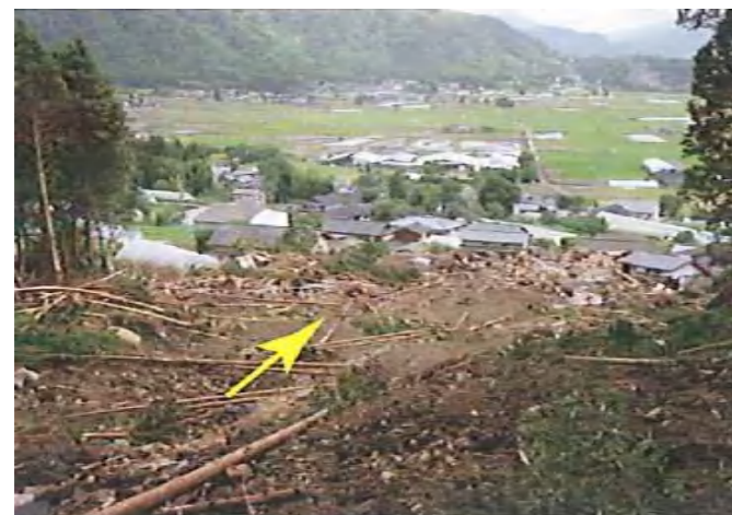
写真. 土砂の堆積状況