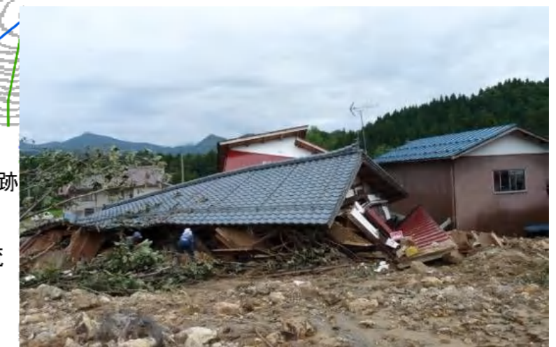
写真. 家屋の被害状況