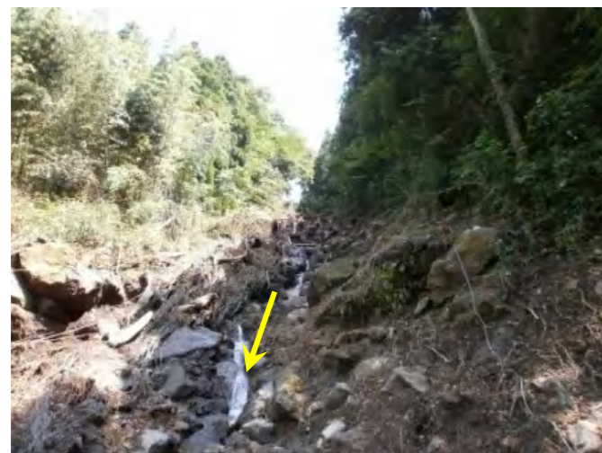
写真. 上流部の侵食状況