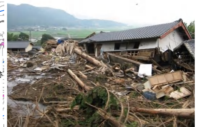
写真. 家屋の被害状況