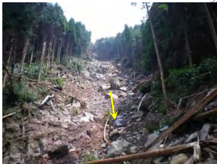
写真. 上流部の侵食状況