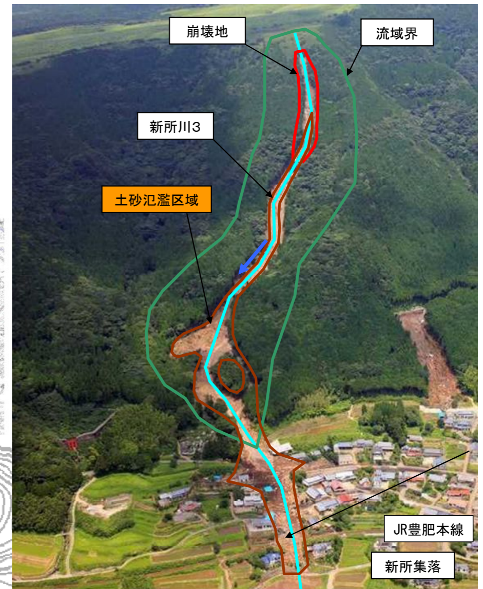
写真. 災害直後の状況