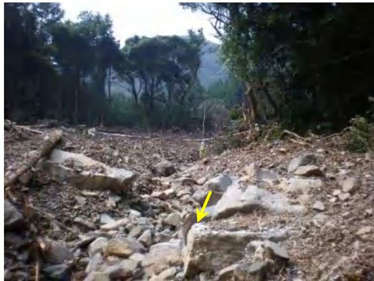
写真. 土砂の堆積状況