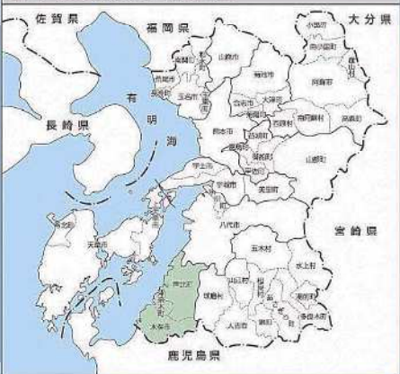
芦北地域振興局管内位置図