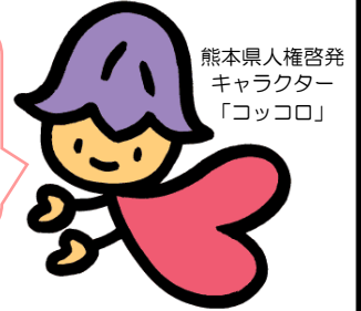
熊本県人権啓発 キャラクター 「コッコロ」