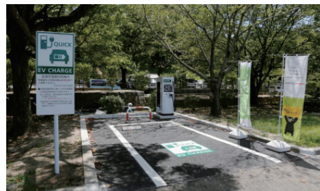
熊本城三の丸第3駐車場