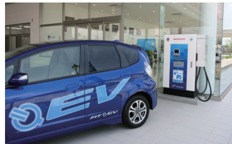
Honda Cars 熊本 宇土店