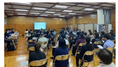
川辺川の河川整備及び国道445号バイパス 整備に向けた測量着手等に関する説明会 (R5.10.19)