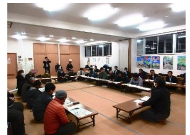
第1回宮園周辺地域振興協議会 (R5.11.14)