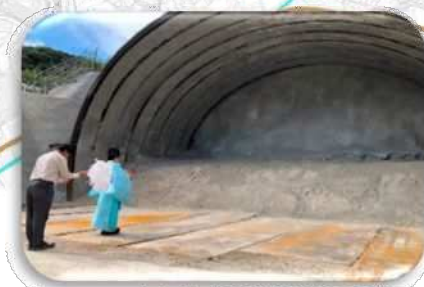
R5.10.2 トンネル安全祈願祭の様子