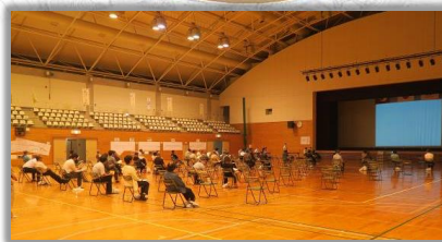
令和2年度 事業説明会の様子