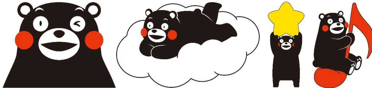
かわいらしさをより強調したもの