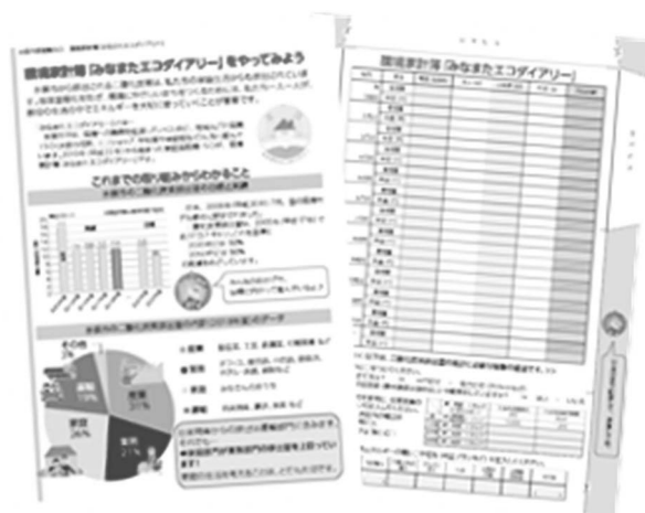
環境家計簿「みなまたエコダイアリー」 <脱炭素社会の実現に向けた取組>