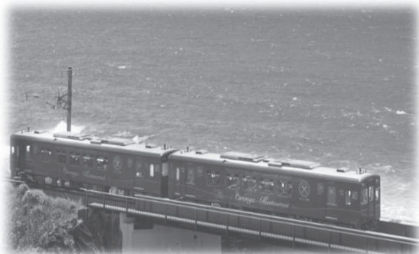
観光列車「おれんじ食堂」