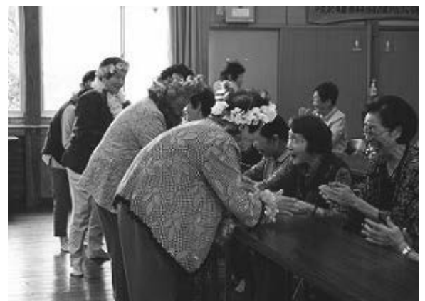
うれしそうに歌うお年寄りたち (芦北町計石地区)