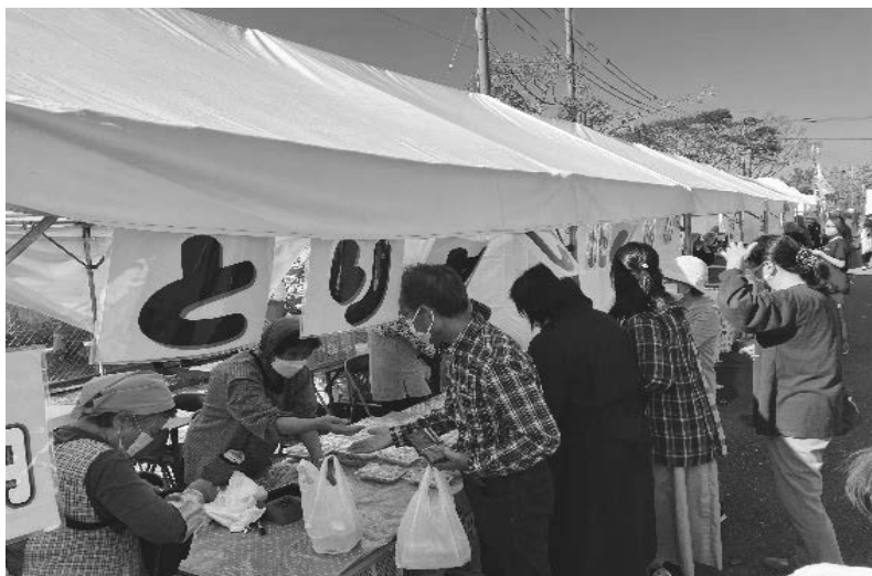
つなぎふれあい祭り（三めし※ブースの出店）※三めし：鯛飯、海老飯、鶏飯 <地域づくりチャレンジ推進事業を活用した地域づくりの支援>