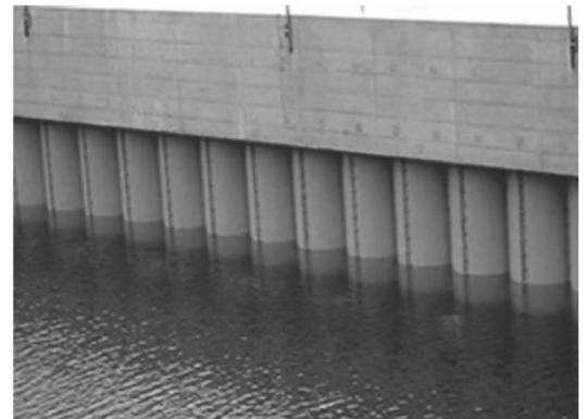
機能保全工事の実施 【竣工】