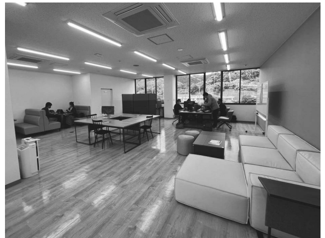
芦北サテライトオフィス田浦 <サテライトオフィス誘致受入施設整備補助事業>