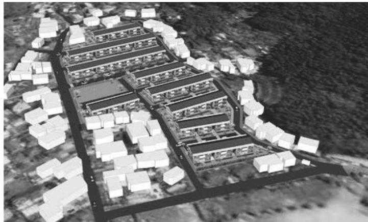
牧ノ内団地（水俣市）完成イメージ <公営住宅の整備・改修>