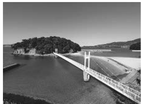
湯の児海水浴場 <魅力ある湯の児温泉づくり事業>