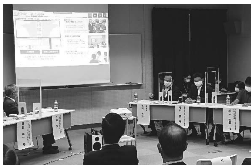
水俣環境アカデミアシンポジウム 「地域資源を活かした持続可能な地域づくり」 〈水俣環境アカデミア活動推進事業〉