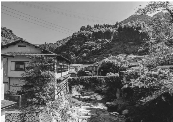
湯の鶴温泉街 <湯の鶴温泉街活性化による観光振興>