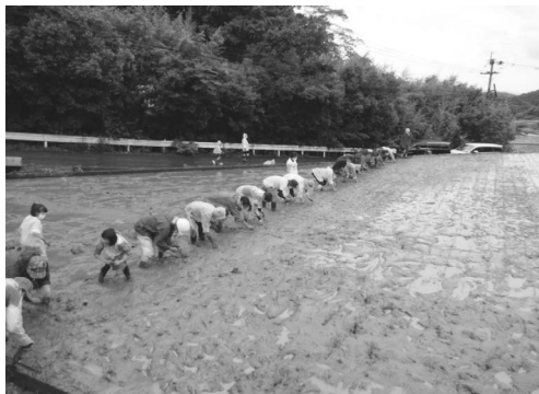
環境保全型農業の体験学習 〈水俣・芦北地域環境フィールドミュージアム事業〉