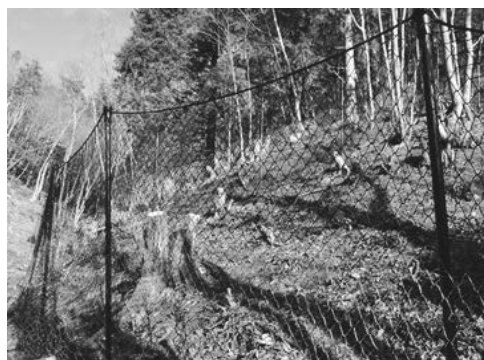
鳥獣被害防止柵 <鳥獣被害防止対策>