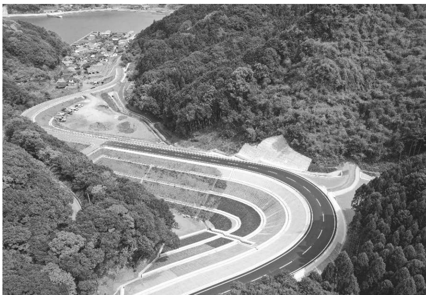
主要地方道：水俣田浦線（福浦2）（津奈木町合串～福浦）R4 供用開始 <道路改良事業>