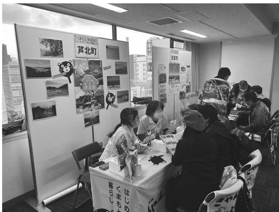
移住相談会 <移住定住の促進>