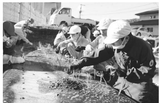
サラダたまねぎ苗植え体験