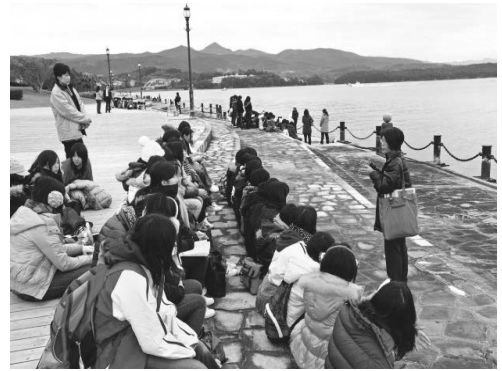
エコパーク水俣での環境学習 〈水俣・芦北地域環境フィールドミュージアム事業〉