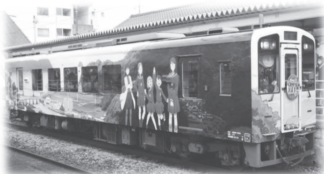
人気アニメ「放課後ていぼう日誌」ラッピング列車の運行