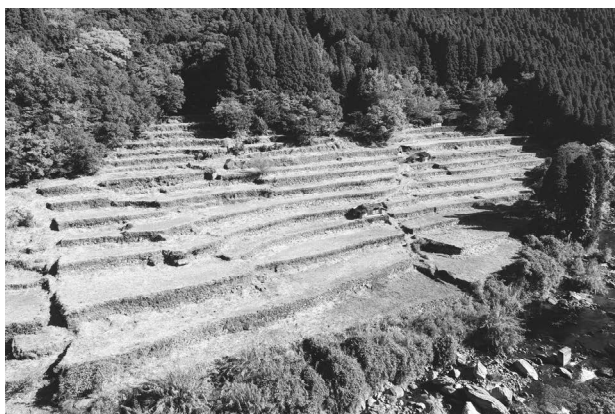
湯の鶴棚田 <湯の鶴棚田景観形成事業>