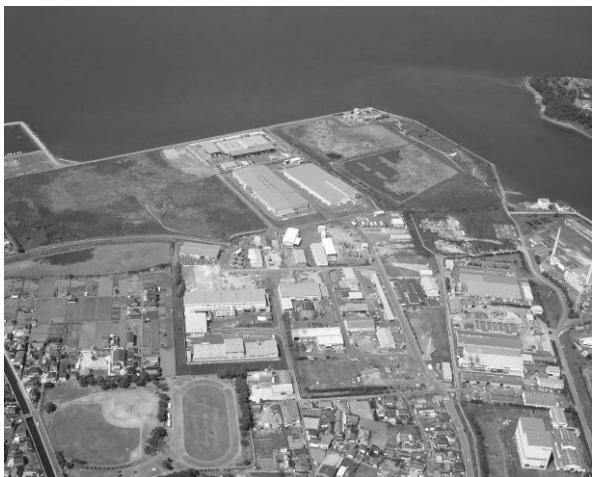
水俣産業団地（水俣エコタウン） <県南地域における企業立地促進事業>