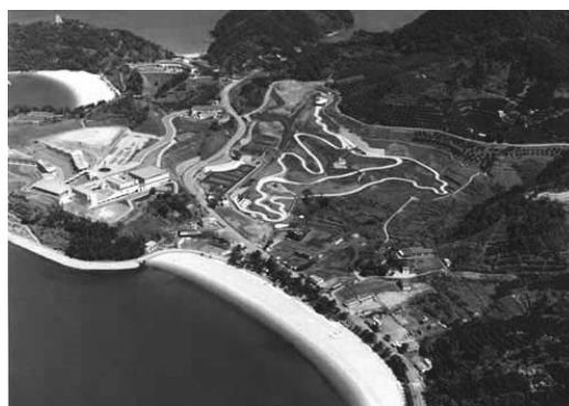
芦北海浜総合公園 <芦北海浜総合公園施設長寿命化事業>