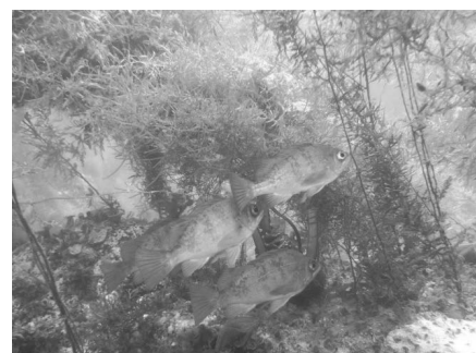
アカモクとメバル