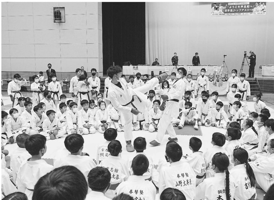
トップアスリート招聘イベント <スポーツ振興支援事業>