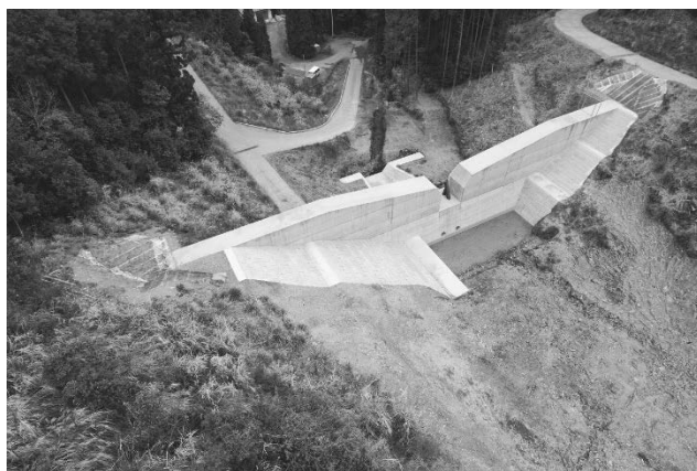
砂防事業（上初野川砂防えん堤：水俣市）