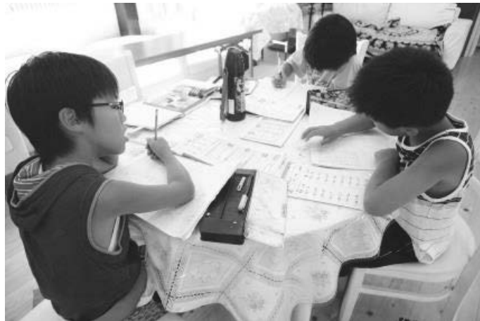
西方寺古城クラブ（水俣市 中央保育園学童クラブ） <放課後児童クラブ施設整備事業>