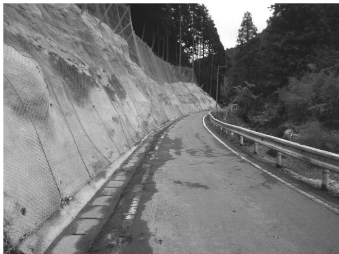
道路防災対策事業（芦北坂本線：芦北町）