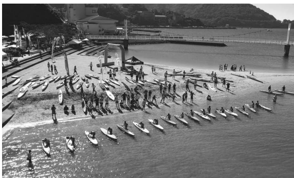
マリンアクティビティイベントの開催 <海の魅力発信事業>

津奈木町の主要施設が集積するつなぎ温泉四季彩周辺の魅力アップを図るため、基本構想及び実施設計に基づいて、宿泊施設などのハード整備を実施する。