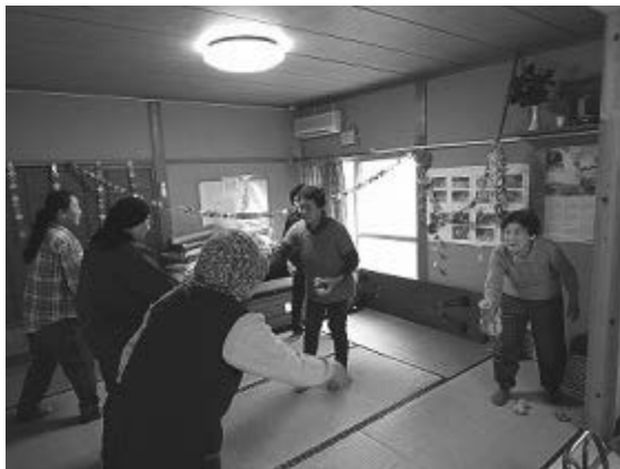
楽しみながら体を動かすお年寄りたち (芦北町道川内地区)