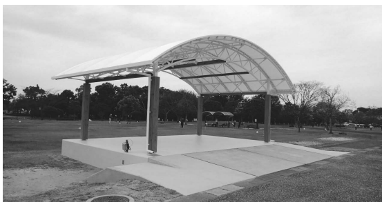
イベントステージ ＜都市公園事業＞

第七次水俣・芦北地域振興計画における各市町の重点施策について、計画期間内の目的達成を強力に後押しするため、財政的な理由により計画期間内での完了が困難な事業について、県が各市町に対し支援を行う。