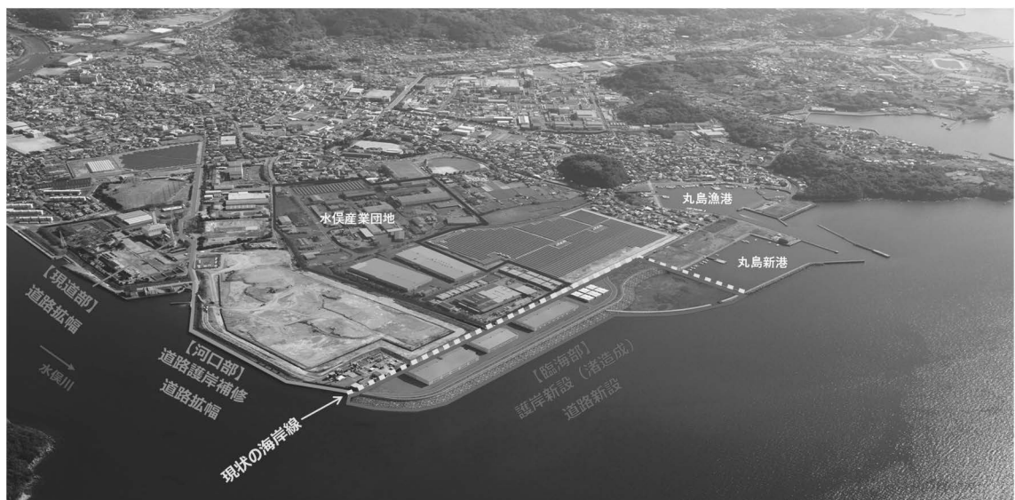
水俣川河口臨海部振興構想イメージパース ＜水俣川河口臨海部振興構想の推進＞