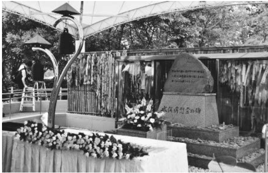
水俣病慰霊の碑 〈水俣病犠牲者慰霊式〉