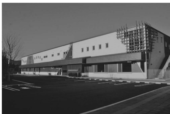
芦北町総合コミュニティセンター <芦北町総合コミュニティセンター管理運営事業>