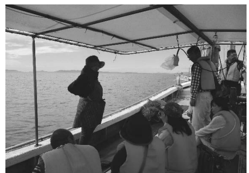
「うたせ船で水俣病を学ぶ」講座 〈水俣病関連情報発信支援事業〉