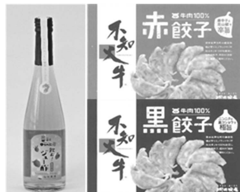
新商品の開発支援