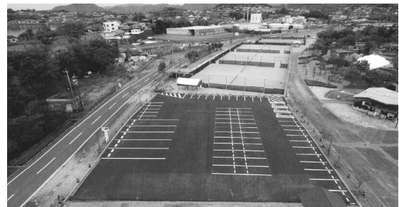
駐車場（テニスコート） ＜熊本県公園施設長寿命化対策支援事業＞