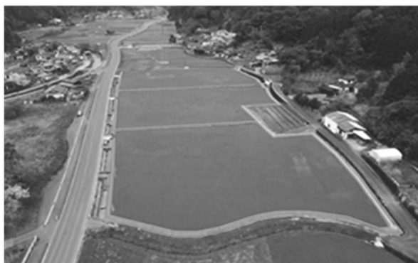
芦北地区横手工区 農地の区画整理