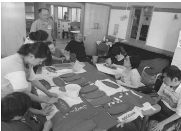
交流サロンでの創作活動の様子 ＜胎児性・小児性水俣病患者等に係る地域生活支援事業＞