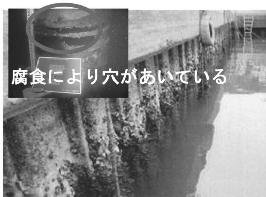
機能保全工事の実施 【着工前】

漁船、うたせ船、貨物船が混在して航行している佐敷港内について船舶航行の安全性向上のため、平成 27 年度（2015 年度）に砂利運搬場を女島地区へ機能移転させた後の計石地区の有効活用について、芦北町等と協議を進める。