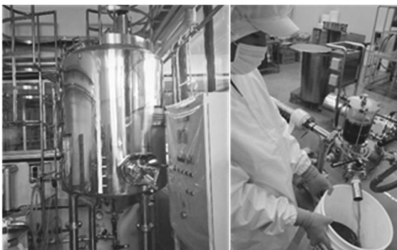
清澄果汁製造設備の導入