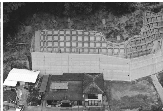
急傾斜地崩壊対策事業（山口地区：芦北町）