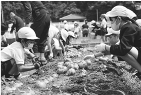
サラダたまねぎ収穫体験