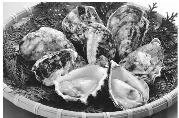
クマモト・オイスター