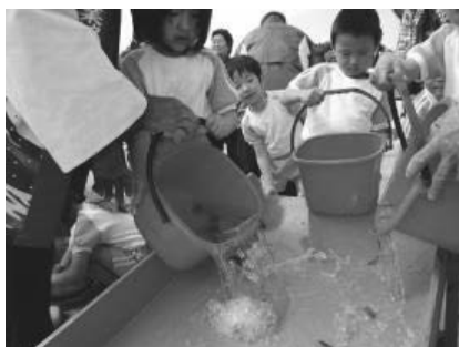
ヒラメの放流風景