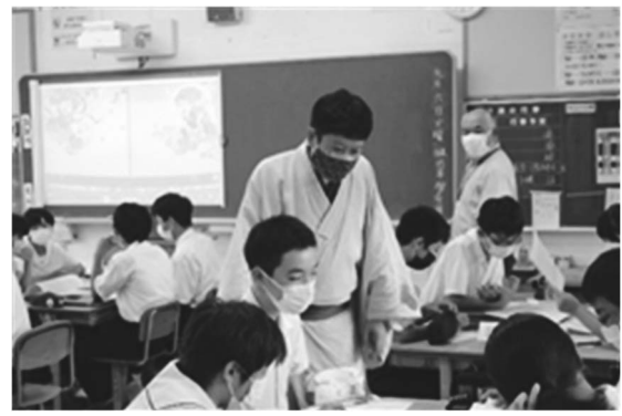
山本太郎ニッポン画プロジェクト <美術館を活用した住民参画型アートプロジェクト>