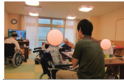
介護職員が食事介助する様子