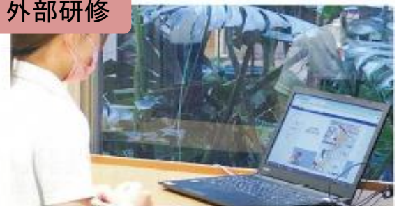
大学、行政等が主催する研修に参加 (例:認知症実践者研修 等)