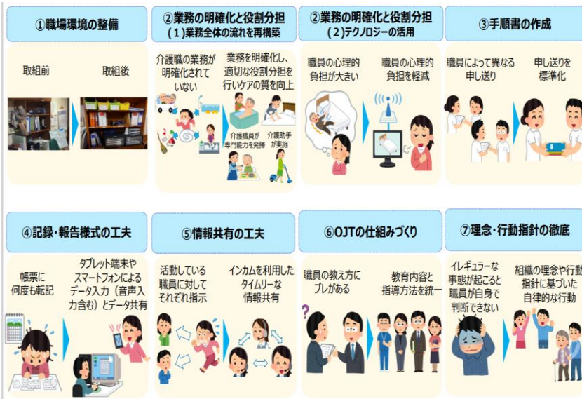
インカムと移乗支援機器を活用した介護