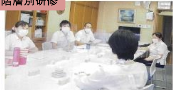
役職ごとに定めた研修