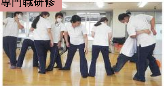
ソーシャルワーカー研修、看護研修 等 (上記はチームビルド研修の様子)