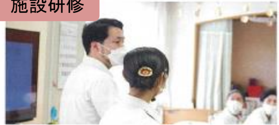
施設の職員として必要となる基礎研修 毎月第3土曜日にスタッフ全員が参加