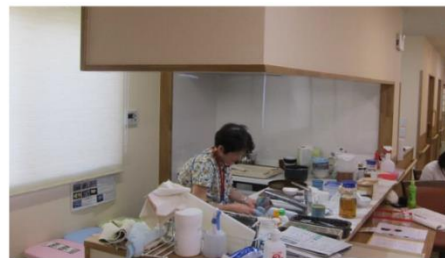
食事の片付けをする介護アテンド職の様子