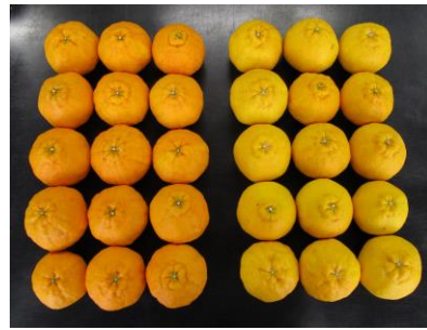
写真2 果実分析時の果実比較 (左:「聖秀」、右:「肥の豊」)