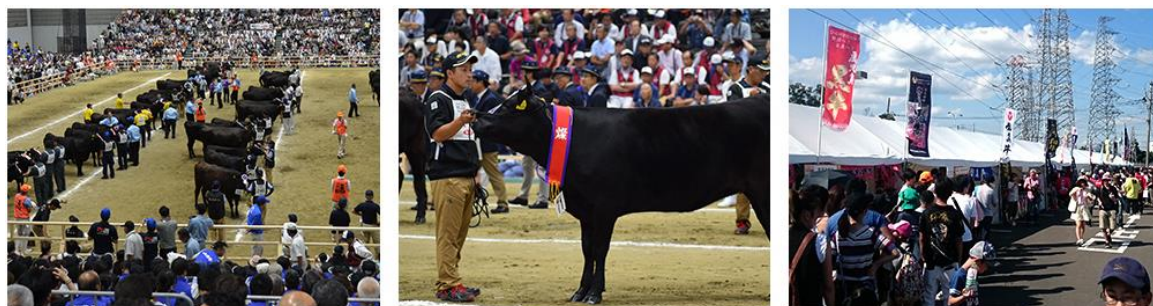
第11回 宮城大会の様子

最後になりますが、出品者ならびに関係者の皆様の本大会での健闘を心より祈念しております。