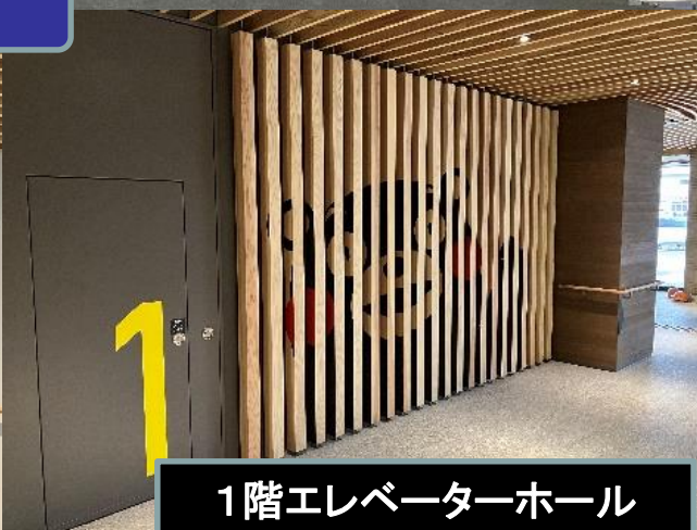
1階エレベーターホール