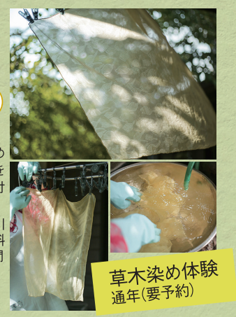
草木染め体験 通年(要予約)

☎0967-62-2292 阿蘇郡南阿蘇村白川1648-6 園10時~17時 園不定 園体験料2500円~※要予約 園九州道熊本ICより1時間 園6台