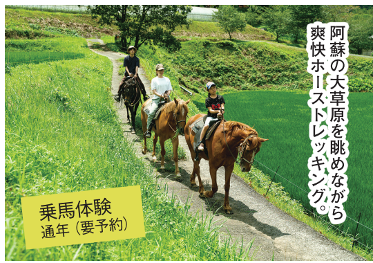
乗馬体験 通年(要予約)

産山村のどかな里山風景や阿蘇の大草原が舞台の乗馬体験。初心者でもスタッフの指導付きだから安心。馬でしか味わえない一体感を感じながら、自然の中でホーストレーニングを楽しもう。