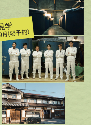
酒蔵見学 3月~9月(要予約)

☎0967-46-2311 阿蘇郡小国町宮原1734-2 園8時30分~17時30分 園土日、年末年始、お盆、GW 園見学無料※要予約 園九州道熊本ICより1時間30分 園5台