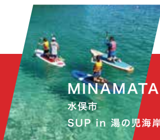
MINAMATA 水俣市 SUP in 湯の児海岸