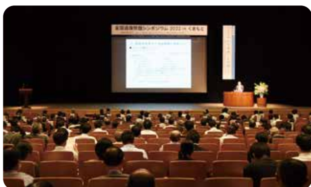
基調講演 (会場風景)