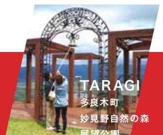
TARAGI 多良木町 妙見野自然の森 展望公園

主催/総務省、全国過疎問題シンポジウム実行委員会 (熊本県、一般社団法人全国過疎地域連盟、全国過疎地域連盟熊本県支部)