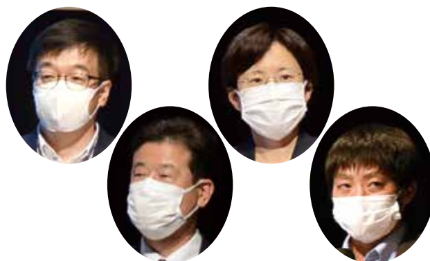
パネルディスカッション パネリスト