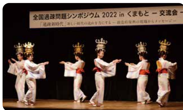
交流会 山鹿灯籠踊り