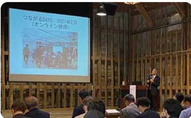
第4分科会（多良木町）