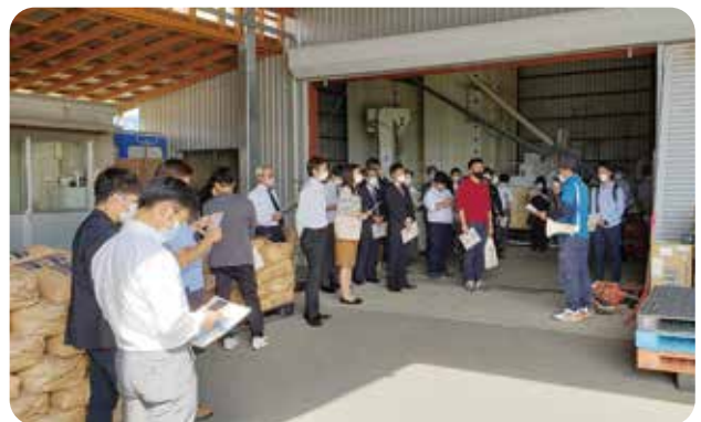
第4分科会 現地視察