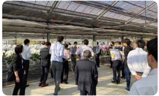
第1分科会 現地視察