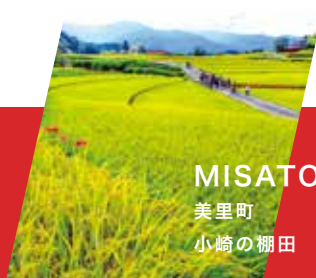
MISATO 美里町 小崎の棚田