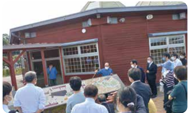
第3分科会 現地視察