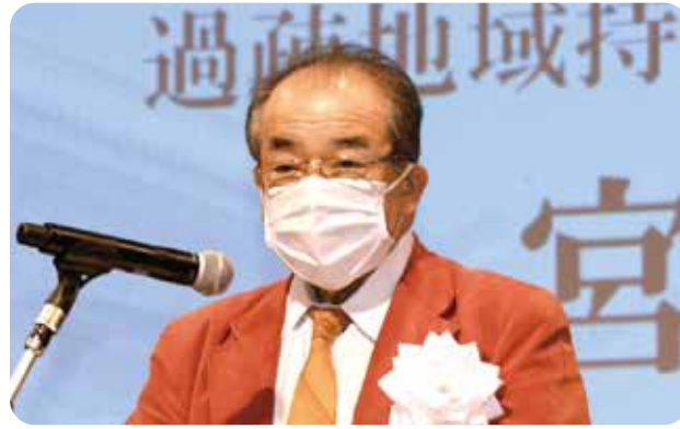
優良事列表彰式 講評