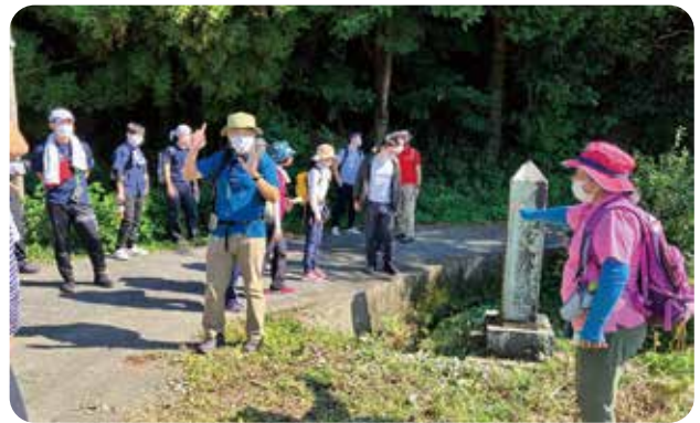
第2分科会 現地視察