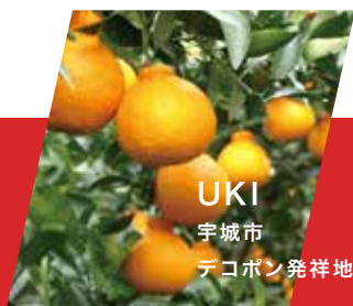
UKI 宇城市 デコボン発祥地