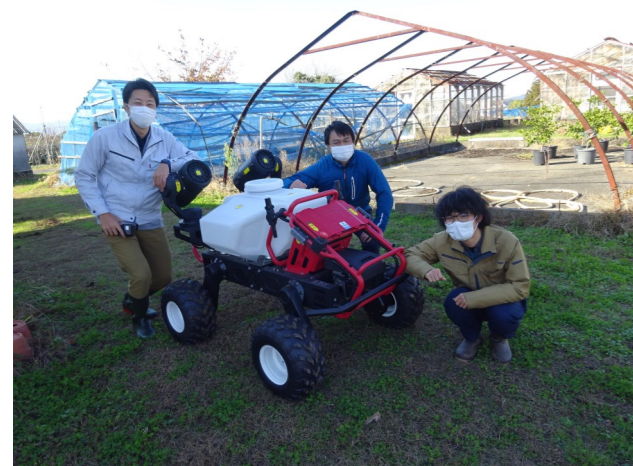
自走式防除機を見せていただきました！