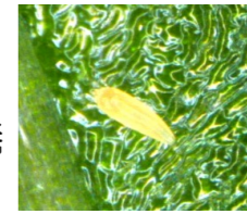
ニセナシサビダニ

ニホンナシにおいてニセナシサビダニが原因と考えられる幼果の果梗裂傷が発生しており、果実肥大の阻害や果梗の折損につながっています。